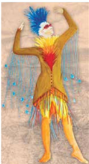
Maquette du Rossignol La Belle au bois dormant Saison 2014 / 2015

Lorsqu'une production est commandée, une équipe artistique est formée, composée d'un metteur en scène, d'un décorateur, d'un éclairagiste et d'un costumier.