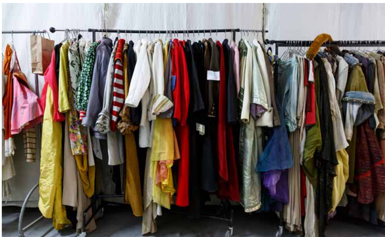
Dans les réserves de Costumes