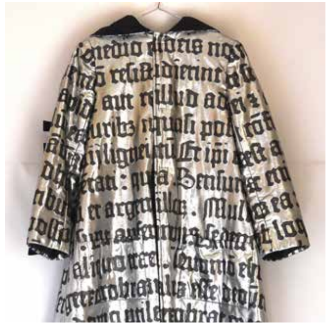
Motif imprimé sur tissu pour La Nuit de Gutenberg Saison 2011 / 2012