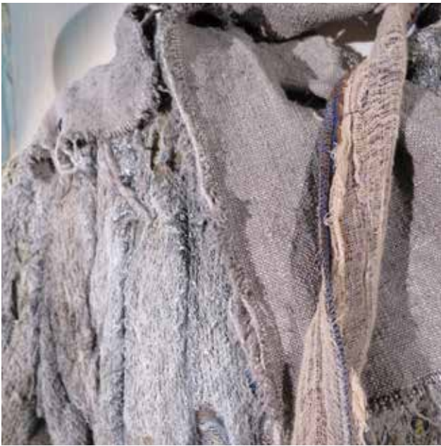
Tissu matiééré pour les Prisonniers de La Maison des morts Saison 2013 / 2014