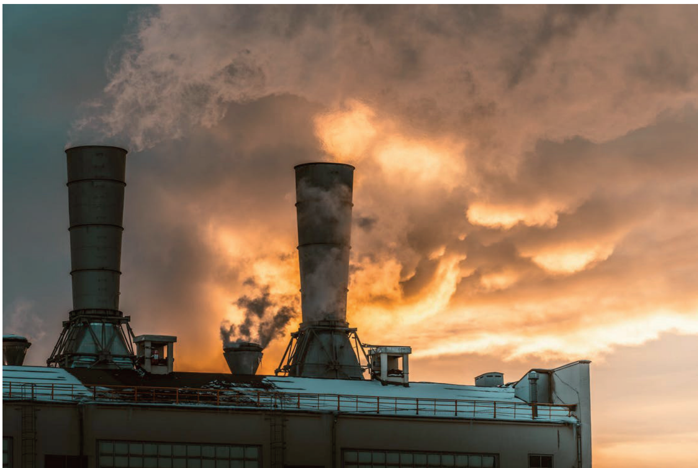
Brouillard dû à la pollution

Les différentes conséquences du réchauffement climatique nous sont malheureusement connues. L'une d'entre elles, parmi les plus importantes, est l'épuisement des ressources naturelles (matières premières, énergies naturelles etc.) que la planète nous offrait jusqu'à présent. En 2018, le «jour du dépassement» est arrivé le 1 er août, ce qui veut dire que l'humanité a déjà consommé toutes les ressources que la planète peut renouveler en un an. L'ONG Global Footprint Network , qui lutte pour le développement durable, souligne d'ailleurs que cette date survient plus tôt que prévu. Pourtant, nous continuons à épuiser nos ressources, par des actions qu'il nous faudrait d'urgence changer : trop forte consommation de viande et de nourriture ultra transformée, agriculture non raisonnée, pollution des espaces verts et maritimes, dégradation des sols, des nappes phréatiques, de la biodiversité etc. À cette indifférence s'ajoutent les politiques capitalistes des grandes entreprises agro-alimentaires, qui surexploitent les sols, souvent en jouant sur les limites de la légalité. L'acquisition des terres par ces puissances mondialisées contribue à la paupérisation des petits producteurs de par le monde.