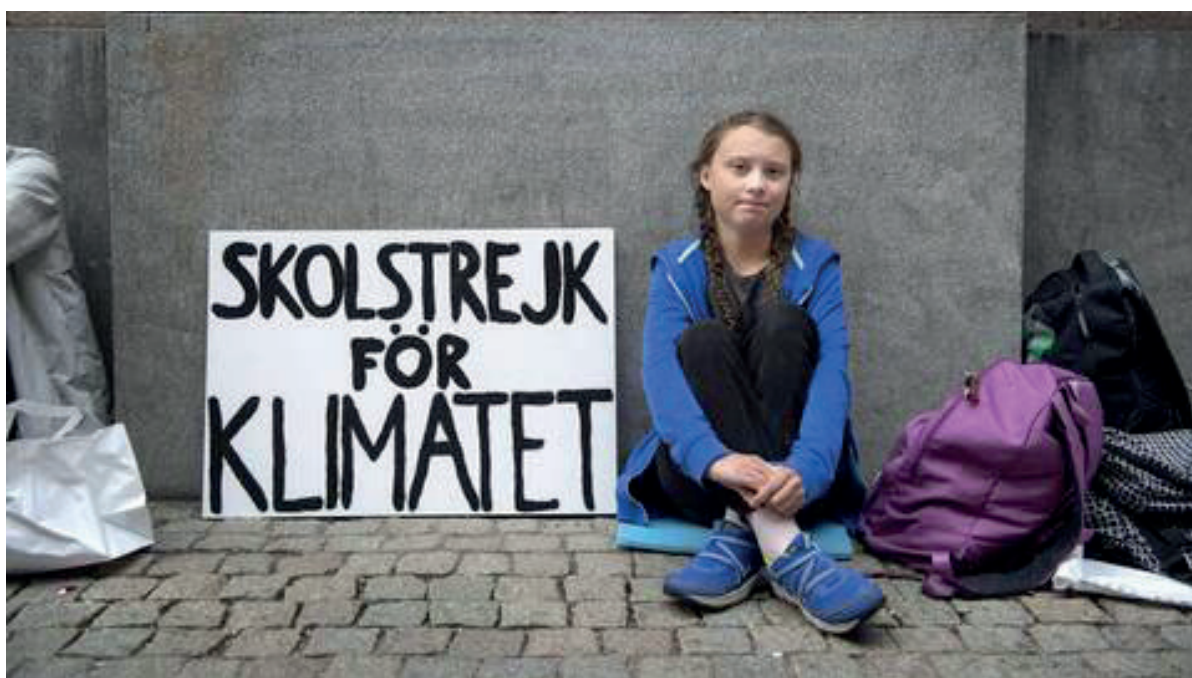
Greta Thunberg «Skolstrejk för klimatet» (Grève scolaire pour le climat) en août 2018

Gretel, Greta, notre opéra ne pouvait que faire entrer en scène une personnalité politique qui nous est tous maintenant bien connue ! Le 20 août 2018, Greta Thunberg faisait grève pour la première fois devant le Parlement suédois, bien décidée à faire comprendre aux responsables politiques l'urgence de la crise climatique que nous étions déjà en train de vivre. Depuis, la jeune suédoise née le 3 janvier 2003 est devenue une figure mondiale de la lutte pour le climat et le symbole d'une jeunesse prête à changer le cours des choses. C'est elle qui initie les premiers «Fridays for future»; des vendredis de manifestation pour le climat qui ont mobilisé, depuis août 2018, des centaines de milliers de lycéens et d'étudiants sur toute la planète.