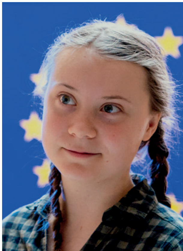
Greta Thunberg au Parlement européen

Alors, je me suis dit : c'est Hansel et Greta [Thunberg] ! Et un autre degré d'évidence m'est apparu : il fallait que ce projet soit écoresponsable, que les enfants y participent pleinement par des ateliers. Que ce soit une façon ludique, joyeuse et magique de prendre conscience de la transformation accélérée que connaît le monde aujourd'hui et d'y contribuer activement.