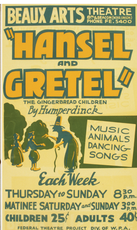
Hänsel und Gretel vers 1936 au Beaux-Arts Theatre