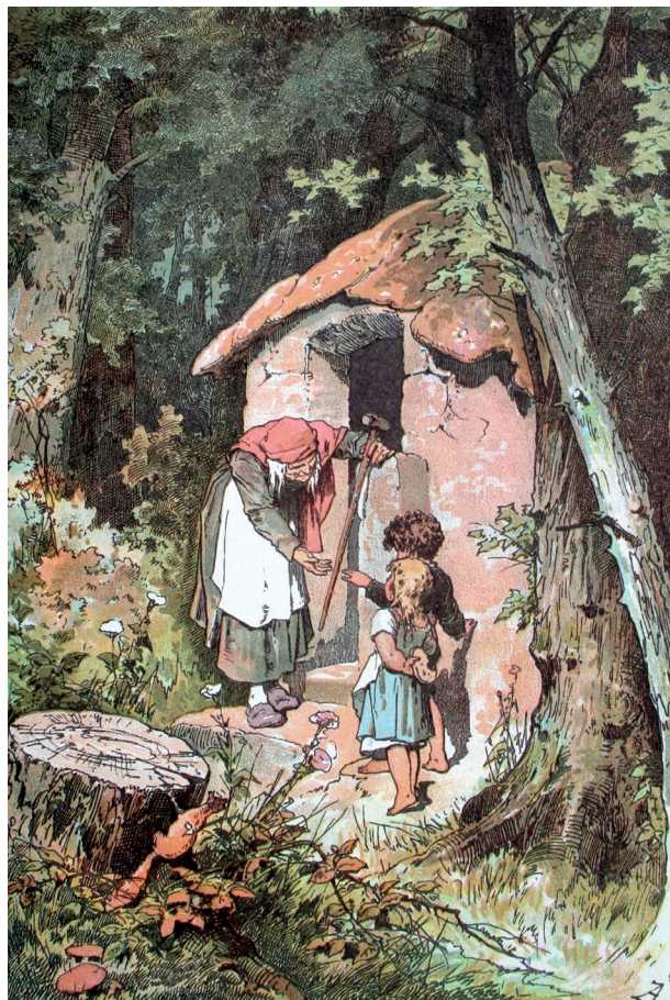
Hänsel und Gretel par Alexander Zick 1845