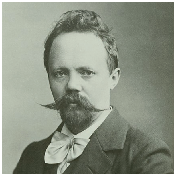
Engelbert Humperdinck en 1854

Connu principalement pour son opéra Hänsel und Gretel , Engelbert Humperdinck est né à Siegburg ville allemande de Rhénanie-du-Nord-Westphalie en 1854. Fils d'un directeur d'école, il est poussé par ses parents vers l'architecture. Il persiste toutefois dans la musique, déjà enclin à la composition dès l'âge de 7 ans. Il entre finalement au Conservatoire de Cologne en 1872 et devient l'élève du chef d'orchestre et compositeur allemand, Ferdinand Hiller. Avec l'obtention d'une bourse en 1876, recevant le prix Mozart de Francfort, il part poursuivre son apprentissage en composition et en interprétation à Munich. Décrochant en 1879 le prix «Mendelssohn Stiftung» de Berlin, il voyage jusqu'à Naples où il rencontre Richard Wagner, de 41 ans son aîné (1813-1883), pour qui il travaille comme assistant et qui aura une immense influence sur son langage musical. Il en viendra même à devenir le tuteur de Siegfried, son fils. Dans cette mouvance, le notoire compositeur l'invite à Bayreuth pour assister à la production de son