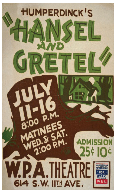
Hänsel und Gretel affiche