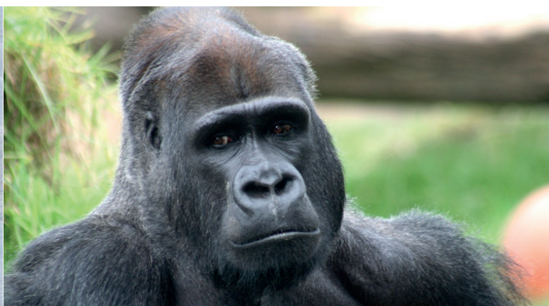
Gorilla gorilla de la famille des hominidés