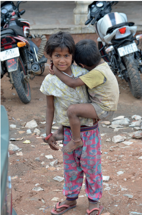
Enfants mendiants en Inde Creative Commons