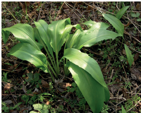
Ail des ours