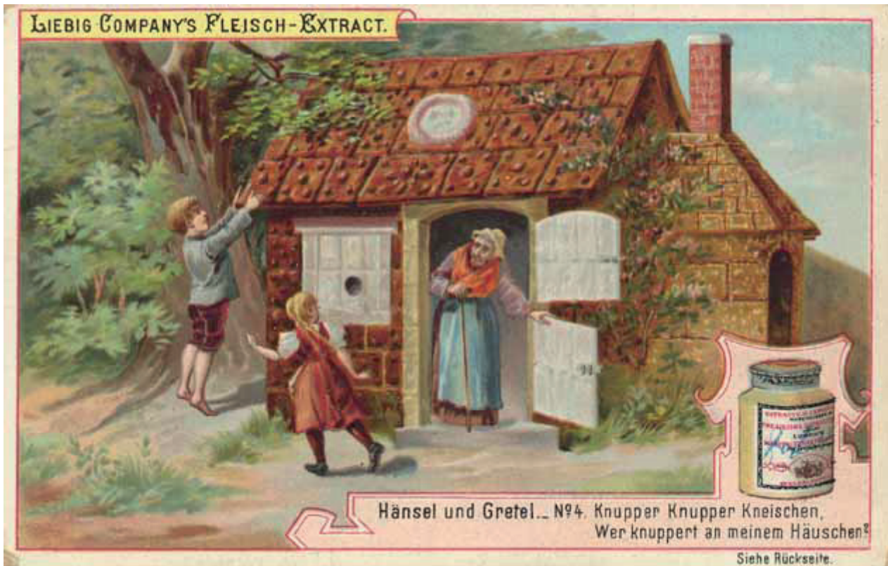
Image « Hänsel und Gretel » extraite d'une collection lancée par la marque Liebig

Hänsel et Gretel est présenté pour la première fois le 23 décembre 1883 à Weimar mais non sans mal. La soliste qui doit interpréter le rôle d'Hänsel – la future Madame Strauss – est clouée au lit à cause d'une mauvaise chute et ne peut assister qu'à la seconde représentation qui a lieu quelques temps plus tard. La partition n'est pas non plus complète pour la première : il manque encore les parties orchestrales de l'ouverture. Malgré ces quelques contretemps, l'opéra est néanmoins un triomphe. Richard Strauss qui dirige la première ne tarit pas d'éloges à son égard : « Quelle merveilleuse polyphonie et le tout est original, nouveau, et si véritablement allemand ! ».