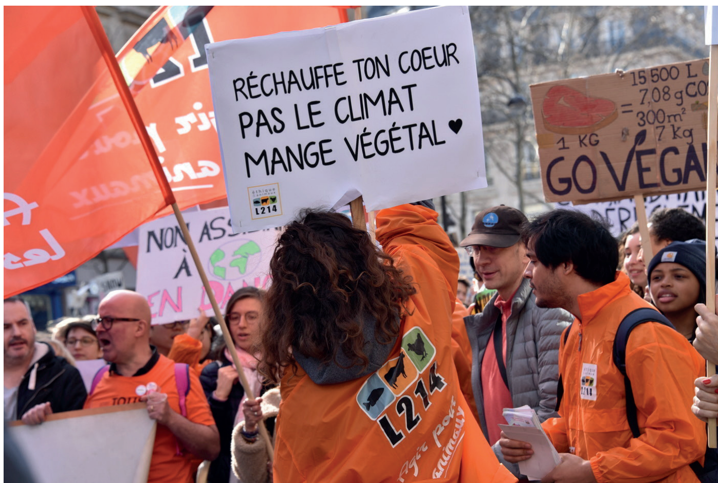
Marche pour le Climat Paris Mars 2019

Suivant l'initiative de Greta Thunberg, nombreux sont les jeunes à organiser des marches mondiales pour le climat aux quatre coins de la planète. En septembre 2019, avant que ne se tienne le sommet de l'ONU pour le climat, plus de 9400 jeunes ont ainsi défilé dans les rues de Paris. Lors de ces nombreuses marches, on pouvait lire sur les pancartes de cette « génération climat » des slogans puissants tels que « Je vote pour la planète », « l'homme se doit d'être le gardien de la nature, non son propriétaire », ou encore « Terrien, sans Terre, t'es rien » ; d'autres ont choisi de mêler humour et triste réalité : « la fonte des glaces je la veux que dans mon rosé », « Jack, il est où l'iceberg ? », « si la planète sèche, alors moi aussi ».