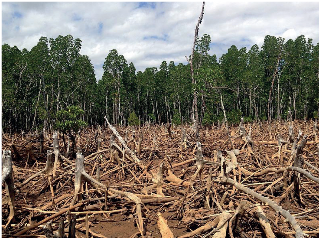
Déforestation à Madagascar

Puis la maison de la sorcière surgissait dans un paysage désolé. C'était une benne à ordures d'où débordaient des emballages plastiques de trash food , jetés sans même avoir été complètement consommés - une aubaine pour les enfants affamés ! Au-dessus, une enseigne : Mme Donald's... Et de fil en aiguille, suivant une logique enfantine, la sorcière est devenue Donald Trump déguisé, gavant de sodas les enfants entravés comme des animaux en batteries à engraisser. Alors Gretel se souvenait de l'enseignement du chaman et se rendait compte que ses pouvoirs étaient supérieurs à ceux de la sorcière. En quelques formules magiques, la sorcière se retrouvait broyée dans la benne à ordures !