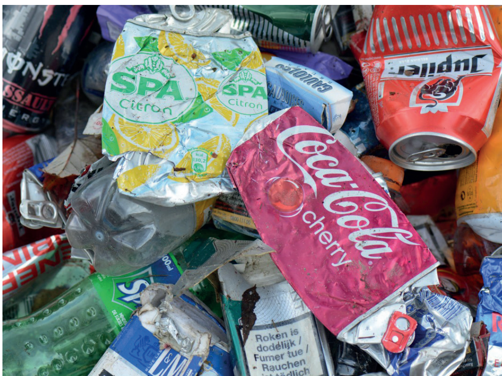
Dépôt d'ordures sauvage

Puis la maison de la sorcière surgissait dans un paysage désolé. C'était une benne à ordures d'où débordaient des emballages plastiques de trash food , jetés sans même avoir été complètement consommés - une aubaine pour les enfants affamés ! Au-dessus, une enseigne : Mme Donald's... Et de fil en aiguille, suivant une logique enfantine, la sorcière est devenue Donald Trump déguisé, gavant de sodas les enfants entravés comme des animaux en batteries à engraisser. Alors Gretel se souvenait de l'enseignement du chaman et se rendait compte que ses pouvoirs étaient supérieurs à ceux de la sorcière. En quelques formules magiques, la sorcière se retrouvait broyée dans la benne à ordures !