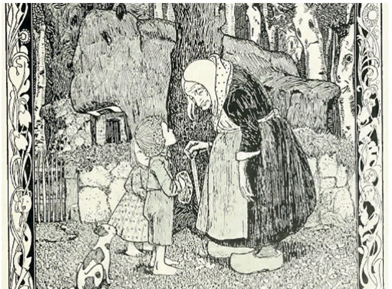
Heinrich Vogeler Hänsel und Gretel , 1902

Les enfants s'avancent dans une forêt de moins en moins hospitalière, jusqu'à ce qu'ils arrivent chez la sorcière... Cette dernière cherche à les attirer à coups de sucreries, mais les enfants ont plus d'un tour dans leur sac.