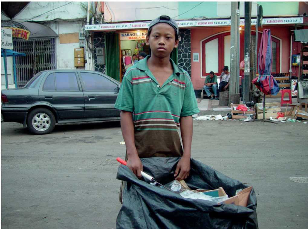
Enfant des rues à Jakarta

Dès le début, cela parlait du travail des enfants dans les usines clandestines, de la faim, de la difficulté des parents à joindre les deux bouts, de la consommation et de la recherche de sources d'énergie. Puis des enfants abandonnés, maltraités, confrontés à la survie dans la forêt qui leur est étrangère, à des ombres menaçantes, à l'angoisse de la culpabilité fondée sur une conception dépassée... En somme, le début de l'opéra exposait les problématiques du monde.