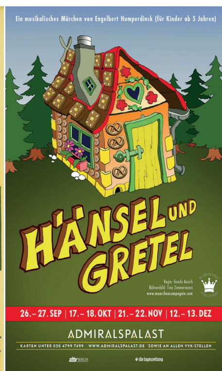
Hänsel und Gretel au Admiralpalast de Berlin