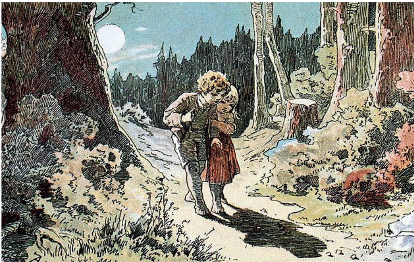
Hänsel und Gretel perdus dans la forêt Alexander Zick 1845-1907