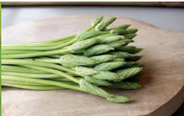
Les asperges sauvages