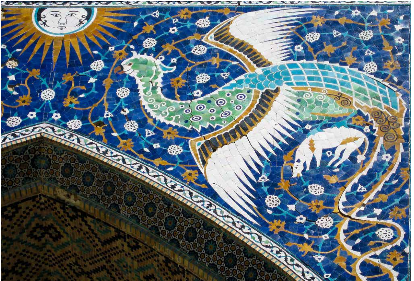
Le Simorgh, oiseau fantastique s'envolant vers le soleil - Mosaïque - OUZBEKISTAN

Ces oiseaux ne quittent pas notre quotidien. À défaut de pouvoir jouir de leurs sifflements dans les villes à cause de la pollution sonore, de nombreuses expressions sont d'usage et font référence à ces êtres ailés, se rapportant parfois à la joie ou à la liberté. Le chant, par son trait aérien, étant autant porteur d'émancipation que l'action de voler.