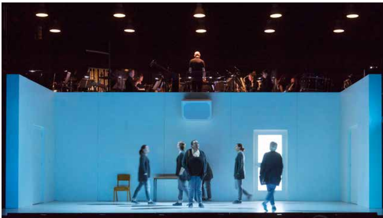
4.48 Psychosis production image (C) ROH. Photo by Stephen Cummiskey

Source : Site ENS de Lyon, La clé des langues, «Je chante sans espoir sur la frontière» : Voix/es de la folie dans 4.48 Psychose de Sarah Kane