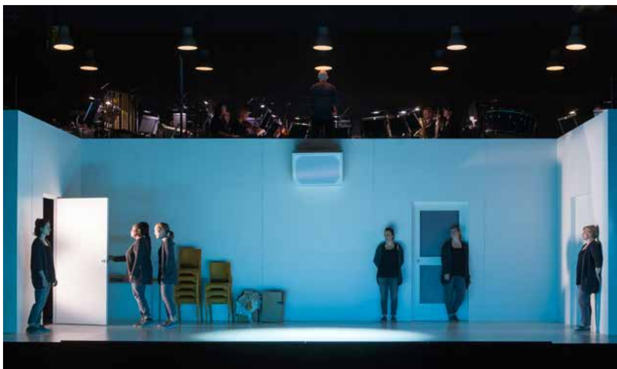
4.48 Psychosis production image [C] ROH. Photo by Stephen Cummiskey