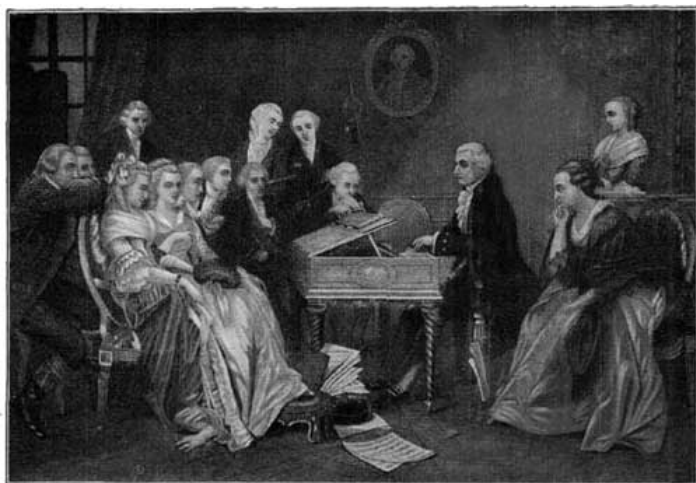
MOZART, AT VIENNA, PLAYING HIS OPERA "DON JUAN" FOR THE FIRST TIME.

Autre exemple : à la première répétition, mécontent du cri poussé par Zerline quand Don Juan, dans les coulisses, attaque sa vertu, Mozart laissa l'orchestre et monta sur la scène. Là, ayant ordonné que l'on reprenne le finale du premier acte à partir du menuet, il se cacha dans la coulisse. Le moment venu de crier pour Zerline, il allongea la main et lui pinça vivement la jambe. Surprise et vive de douleur, elle poussa un cri perçant. « Voilà ! C'est ainsi que je le veux » dit-il en émergeant des coulisses, tandis que Bondini, ne sachant que faire, riait et rougissait à la fois.