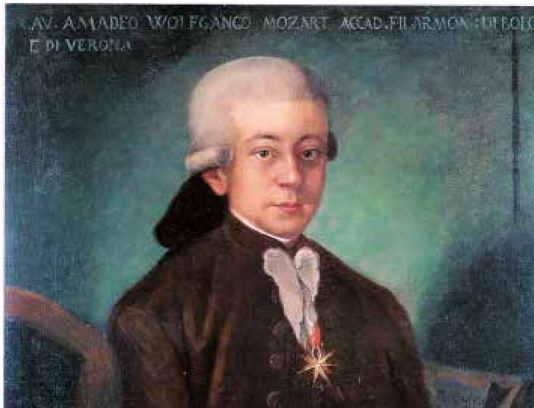
Portrait de Mozart, 1777

De retour à Salzbourg, Mozart y devient une figure marquante de la vie musicale. Il compose alors surtout de la musique de chambre et de la musique pour orchestre, notamment quatre symphonies. En 1775, il compose cinq concertos pour violon et s'attache également à la musique d'église. Mais, à sa grande déception, il n'obtient pas de poste à la cour de Vienne.