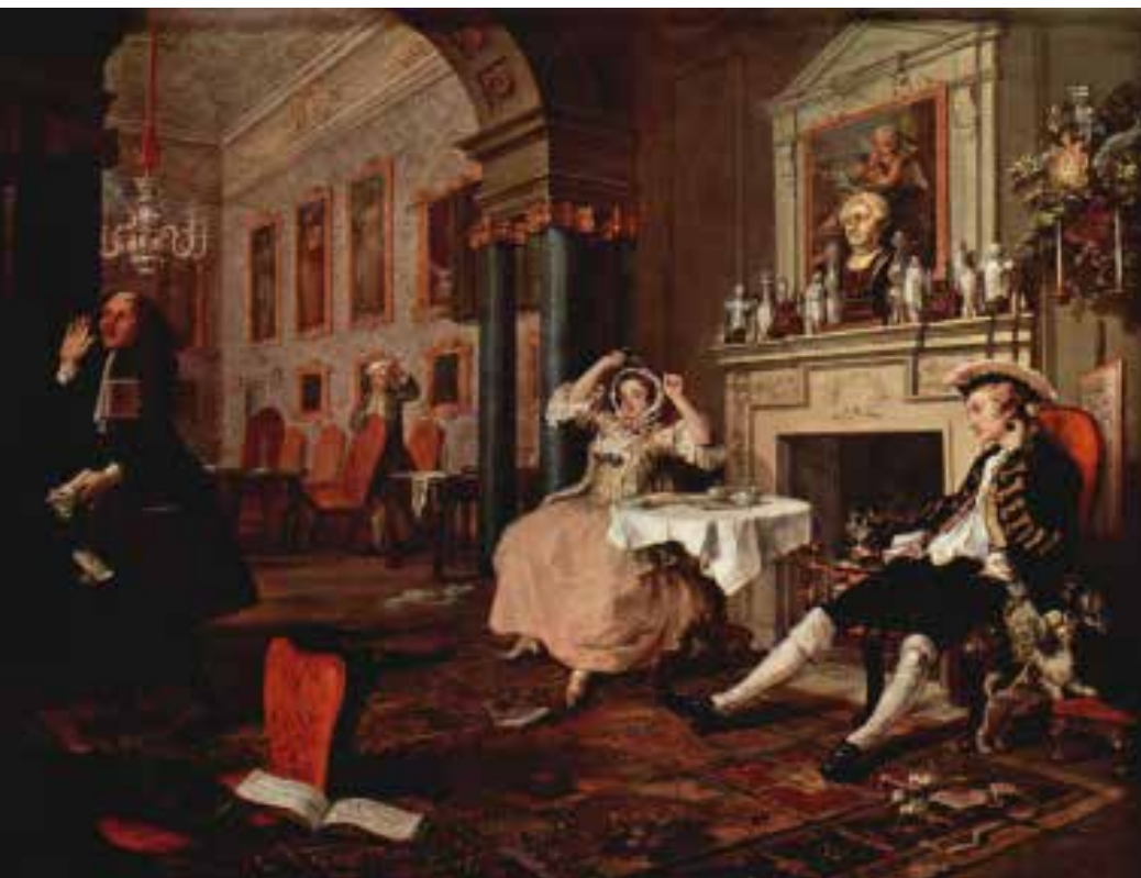
William Hogarth, Marriage A-la-Mode - 2. The Tête à Tête , 1743-1745