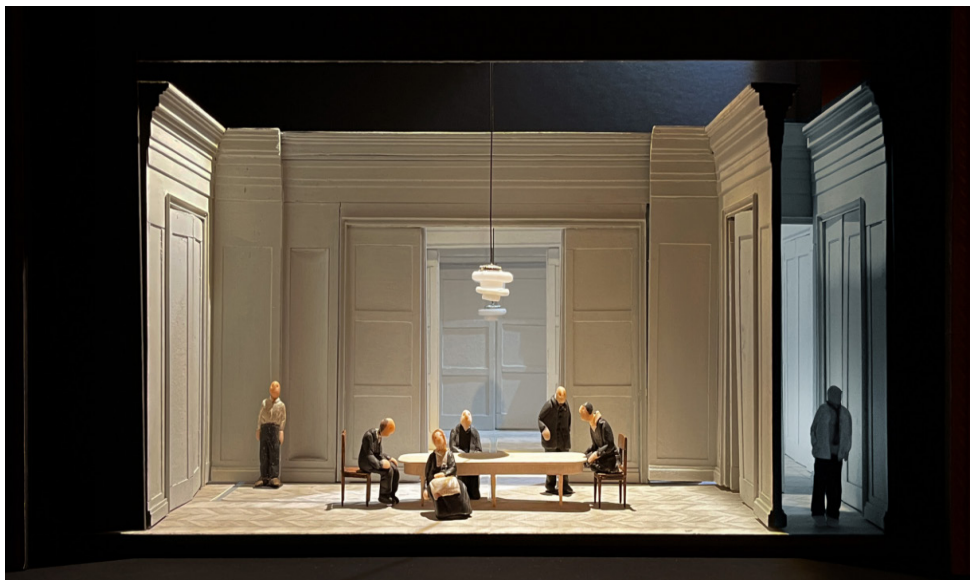
Acte I scène finale