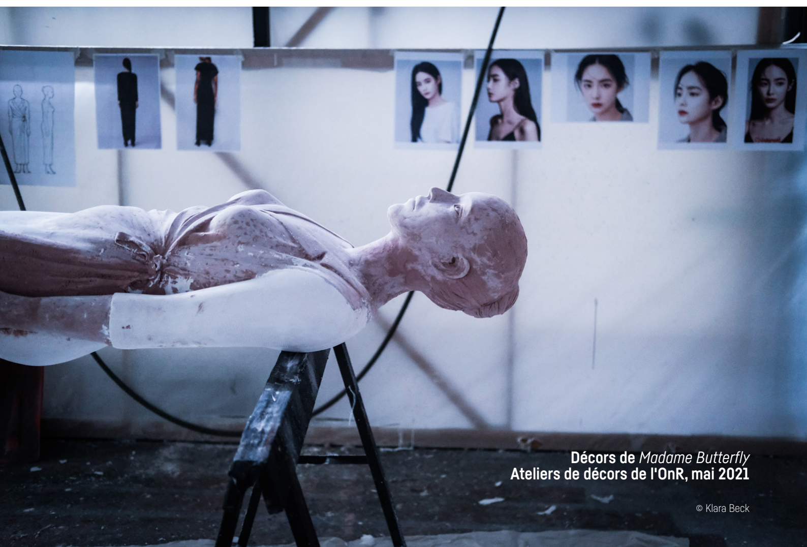
Décors de Madame Butterfly Ateliers de décors de l'OnR, mai 2021