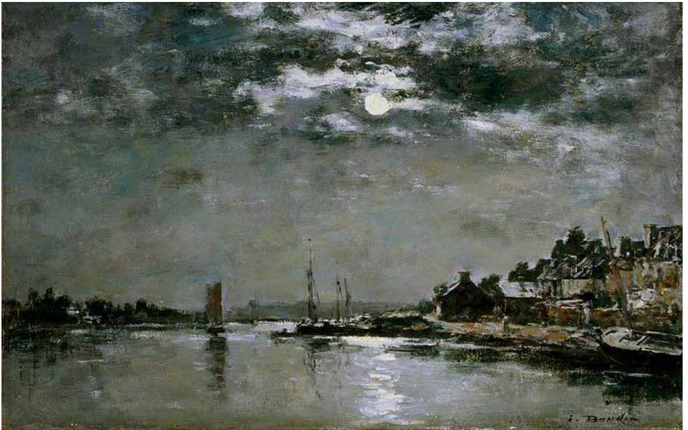
Le village du Faou au clair de lune , Eugène Boudin, entre 1860 et 1865