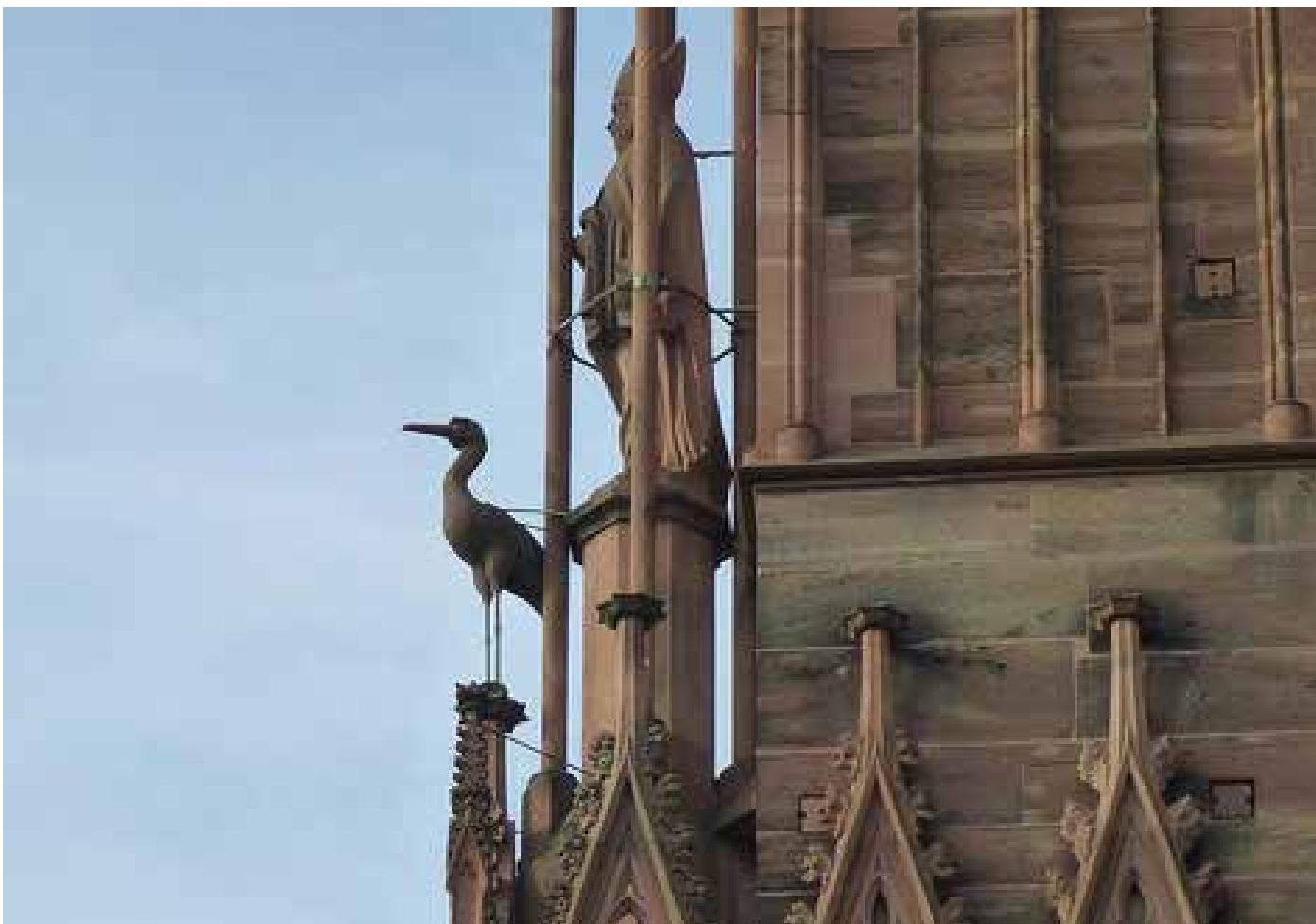
Cathédrale de Strasbourg

Ainsi, cet opéra pour enfants, Les Rêveurs de la Lune , a pour ambition de lui donner une place primordiale. À l'image de sa présence subtile et silencieuse, ce bel animal presque immaculé est interprété sur scène par des enfants déficients auditifs.