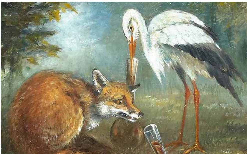
Le renard et la cigogne - Fable d'Esopé, Domenico Terrana

Compère le Renard se mit un jour en frais, et retint à dîner commère la Cigogne. Le régal fût petit et sans beaucoup d'apprêts : Le galant pour toute besogne, Avait un brouet clair ; il vivait chichement. Ce brouet fut par lui servi sur une assiette : La Cigogne au long bec n'en put attraper miette ; Et le drôle eut lapé le tout en un moment. Pour se venger de cette tromperie, À quelque temps de là, la Cigogne le prie. « Volontiers, lui dit-il ; car avec mes amis Je ne fais point cérémonie. » À l'heure dite, il courut au logis De la Cigogne son hôtesse ; Loua très fort la politesse ; Trouva le dîner cuit à point : Bon appétit surtout ; Renards n'en manquent point. Il se réjouissait à l'odeur de la viande Mise en menus morceaux, et qu'il croyait friande. On servit, pour l'embarasser, En un vase à long col et d'étroite embouchure. Le bec de la Cigogne y pouvait bien passer ; Mais le museau du sire était d'autre mesure. Il lui fallut à jeun retourner au logis, Honteux comme un Renard qu'une Poule aurait pris, Serrant la queue, et portant bas l'oreille. Trompeurs, c'est pour vous que j'écris : Attendez-vous à la pareille.