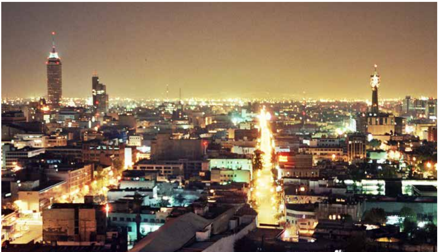
Mexique, City at Night © Fernando Tomas

Ainsi tout se lie. Les lumières artificielles perturbent la vie et l'orientation des oiseaux mais dérèglent aussi les rythmes biologiques et l'esprit créatif des hommes. Alors, tout ne devient qu'inertie.