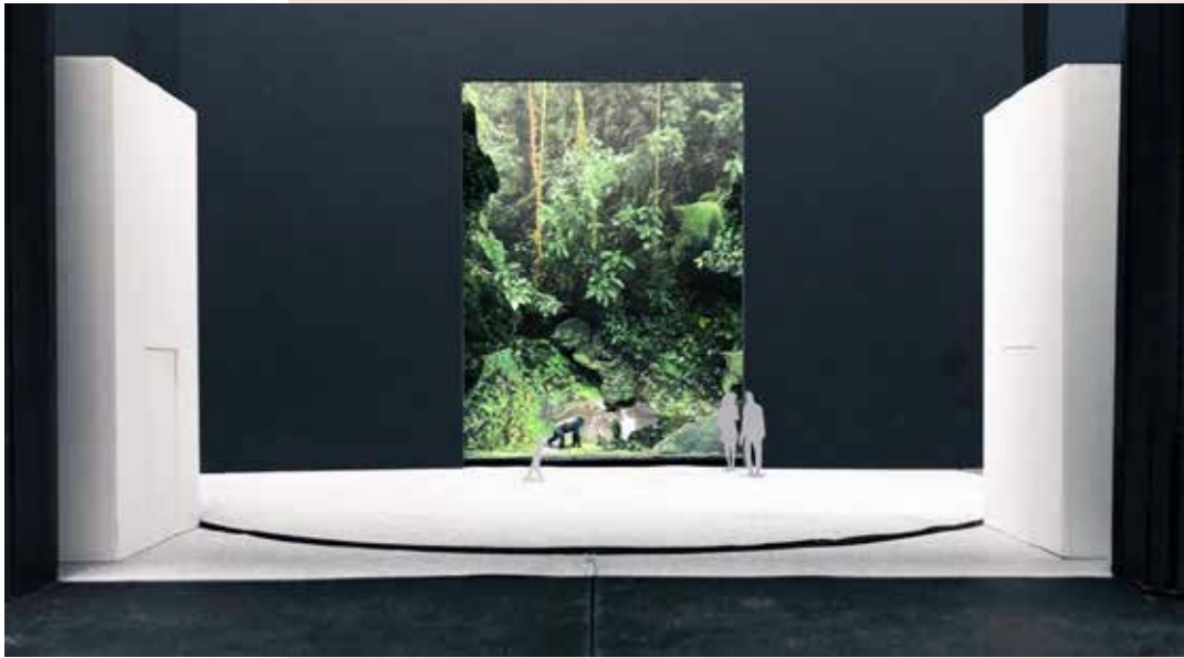
> Photos de la maquette de Parsifal , présentée le 15 janvier 2019 à l'Opéra national du Rhin. © Boris Kudlicka