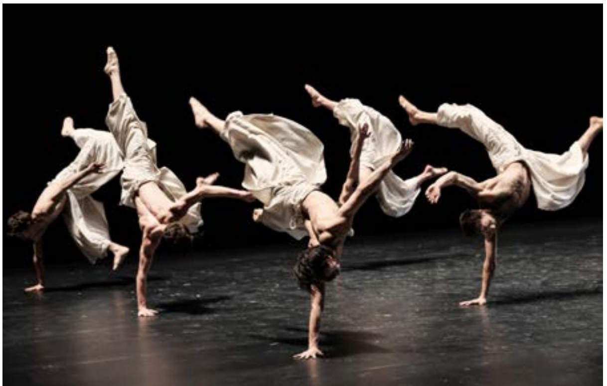
Black Milk , Ohad Naharin Ballet de l'Opéra national du Rhin