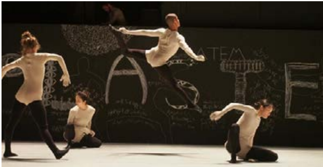
Virus, Ohad Naharin Batsheva Dance Company

2019 , 2019 Décalé , 2018 Yag , 2017 Last Work et Venezuela , 2015 Sadeh 21 , 2011 Hora et Tabula rasa , 2010 Project 5 , 2008 Max et Seder , 2007 George & Zalman , 2006 Three , 2005 Mamootot et Kamuyot , 2003 Naharin's Virus , 2001