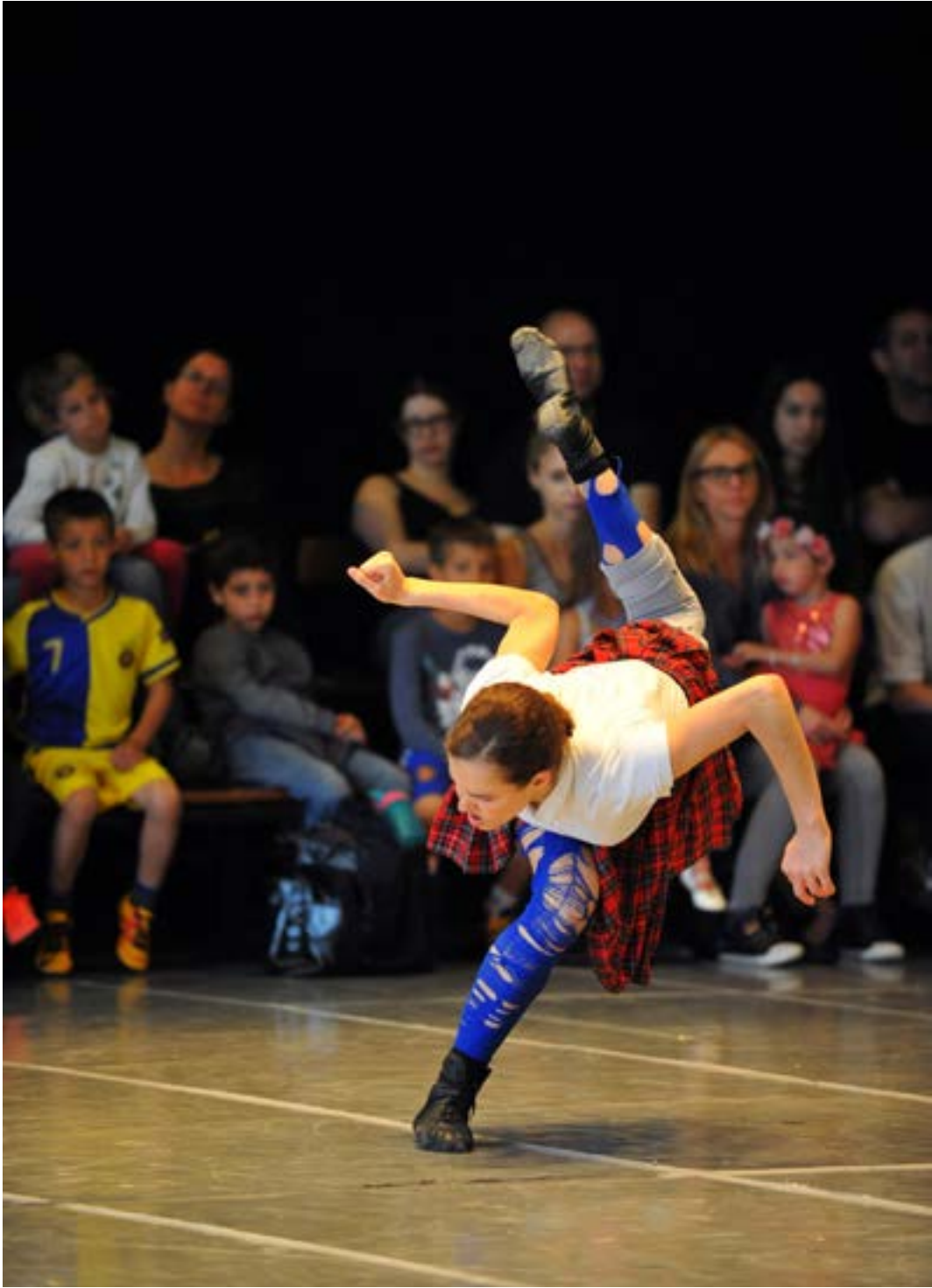
Kamuyot, Ohad Naharin Batsheva Dance Company