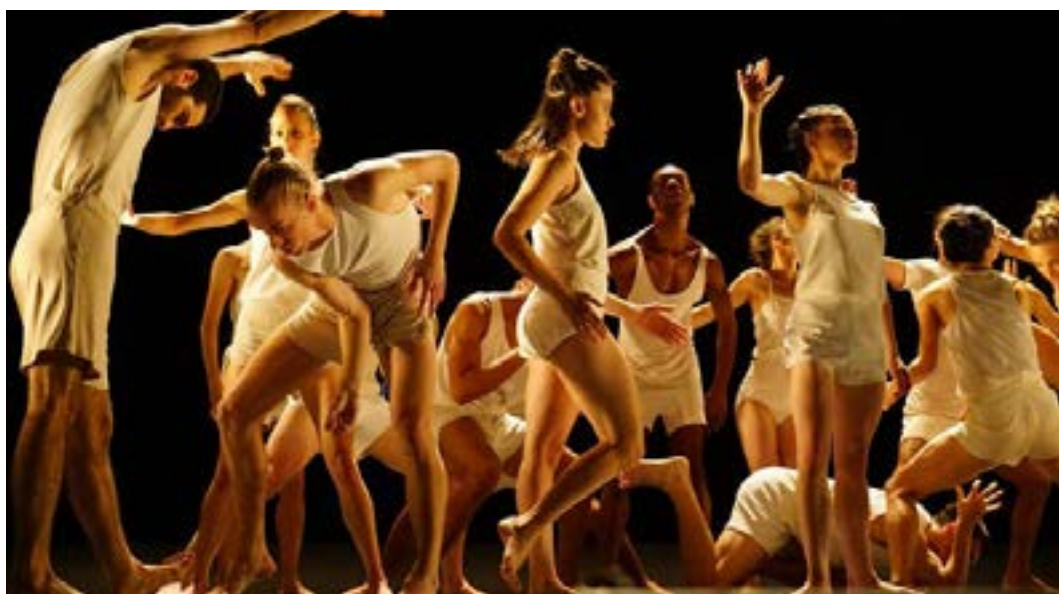
Last work, Ohad Naharin Batsheva Dance Company