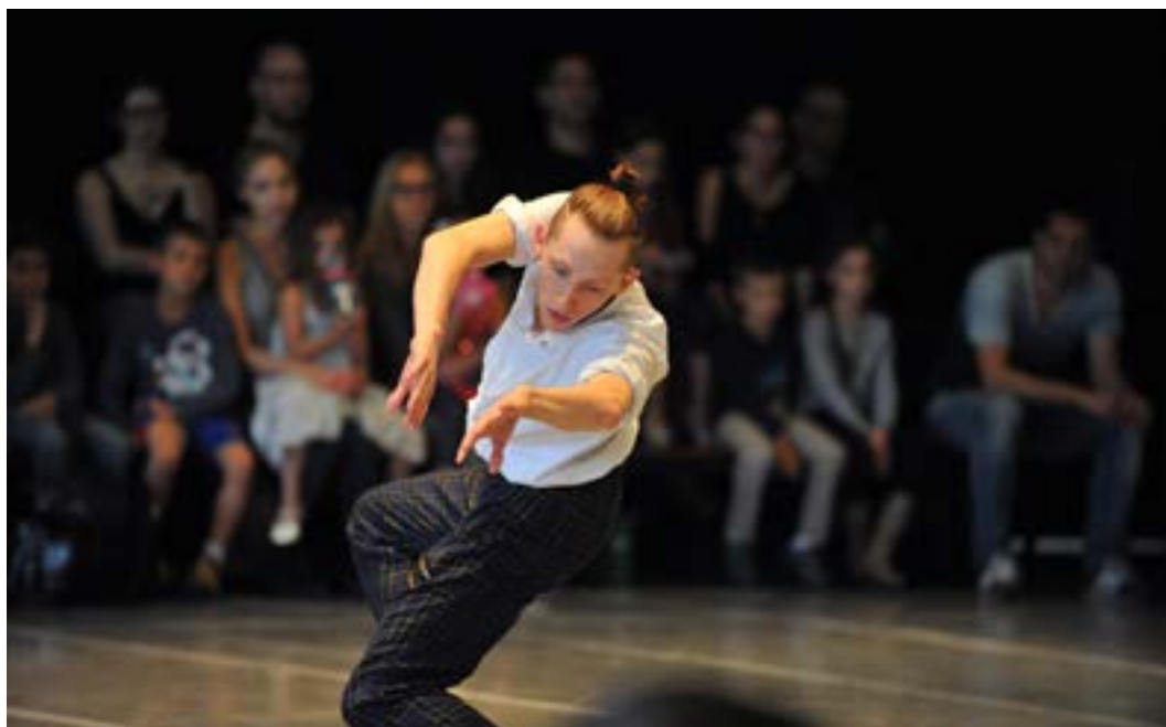
Kamuyot, Ohad Naharin Batsheva Dance Company

Kamuyot est une pièce chorégraphique pour jeune public créée en 2003 par Ohad Naharin, chorégraphe de renom et directeur artistique de la Batsheva Dance Company.