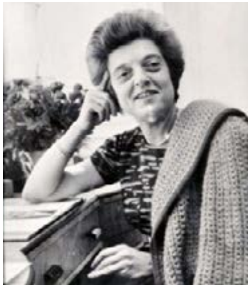
Batsheva de Rothschild

Si le programme est interprété entièrement par le Ballet de l'OnR, Ohad Naharin a par ailleurs sa propre compagnie, la Batsheva Dance Company [qui] réside à Tel Aviv et a été fondée en 1964 par Martha Graham et la baronne Batsheva de Rothshild. Elle est constituée de deux ensembles : la Batsheva Dance Company et le Batsheva Ensemble des Juniors. Avec 250 représentations annuelles en Israël et de très nombreuses dates de tournées partout dans le monde, elle est considérée comme la compagnie israélienne d'excellence. Elle est composée de dan-