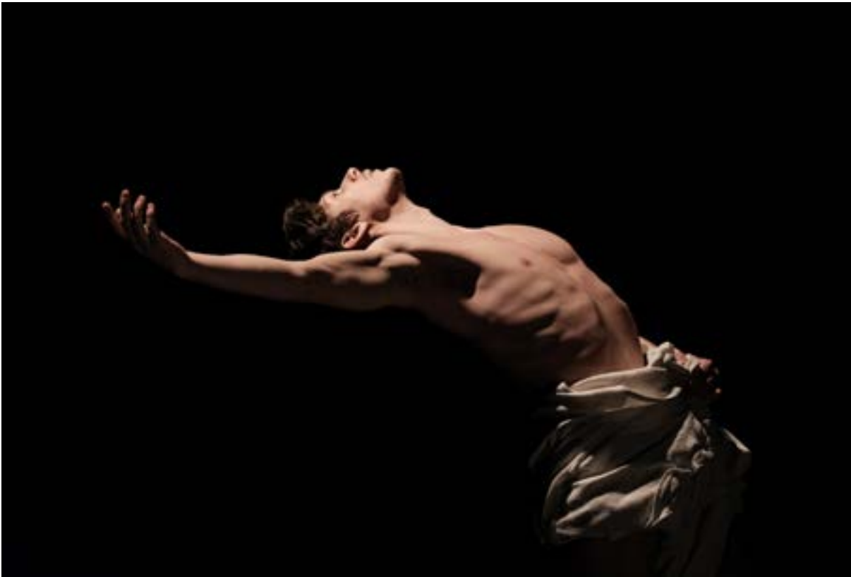
Black Milk , Ohad Naharin Ballet de l'Opéra national du Rhin