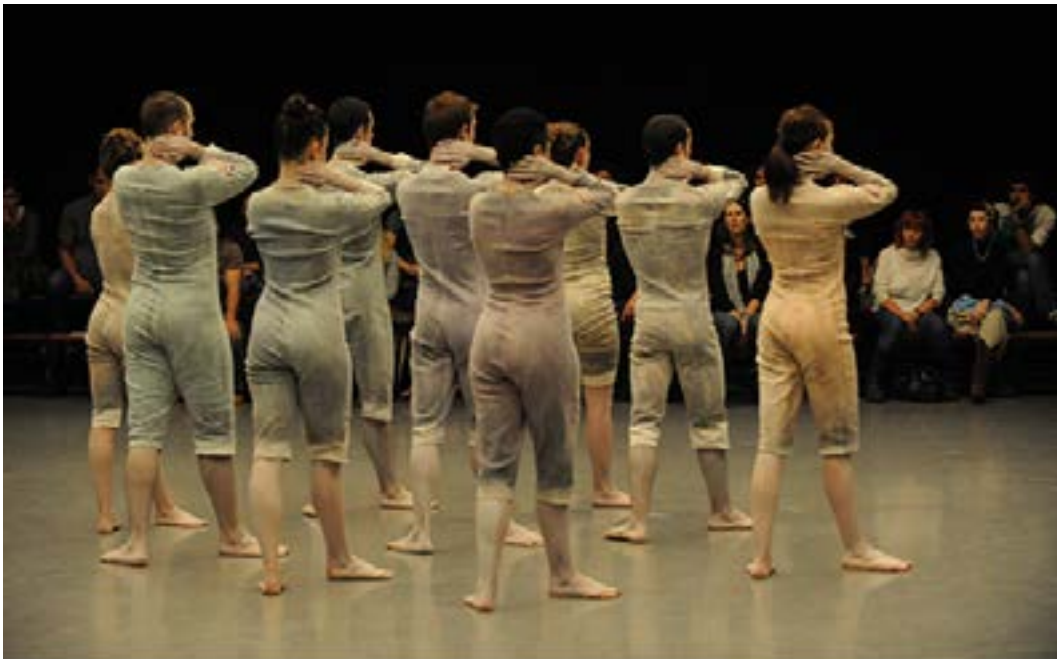
Mamootot, Ohad Naharin Batsheva Dance Company

Kamuyot est nourri par deux chorégraphies : Mamootot (2003) et Moshe (1999) de Ohad Naharin