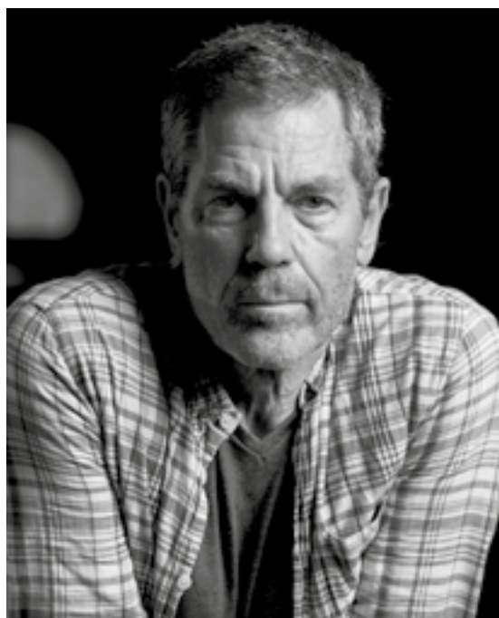
Ohad Naharin

Le chorégraphe israélien Ohad Naharin est le chorégraphe résident de la Batsheva Dance Company et le créateur du langage corporel Gaga. Né en 1952 à Mirza en Israël d'une mère chorégraphe et professeur de danse, il intègre la Batsheva Dance Company en 1974 sans véritable formation initiale. Au cours de sa première année, Martha Graham, chorégraphe en résidence au sein de Batsheva, l'invite à rejoindre sa propre compagnie à New York. Il approfondit sa formation à l'école de ballet américain et à la Juilliard School. Il fait ses débuts en tant que chorégraphe en 1980 et présente ses pièces à New York et dans le monde entier,