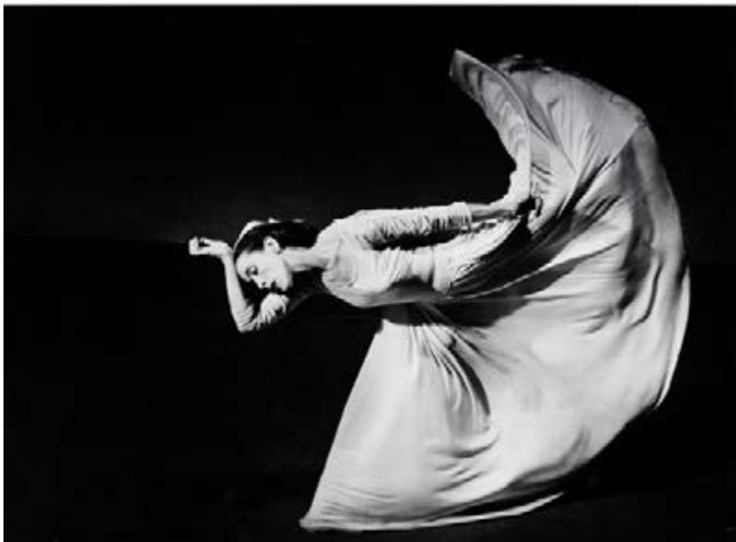
Martha Graham, créatrice en 1964 de la Batsheva Dance Company