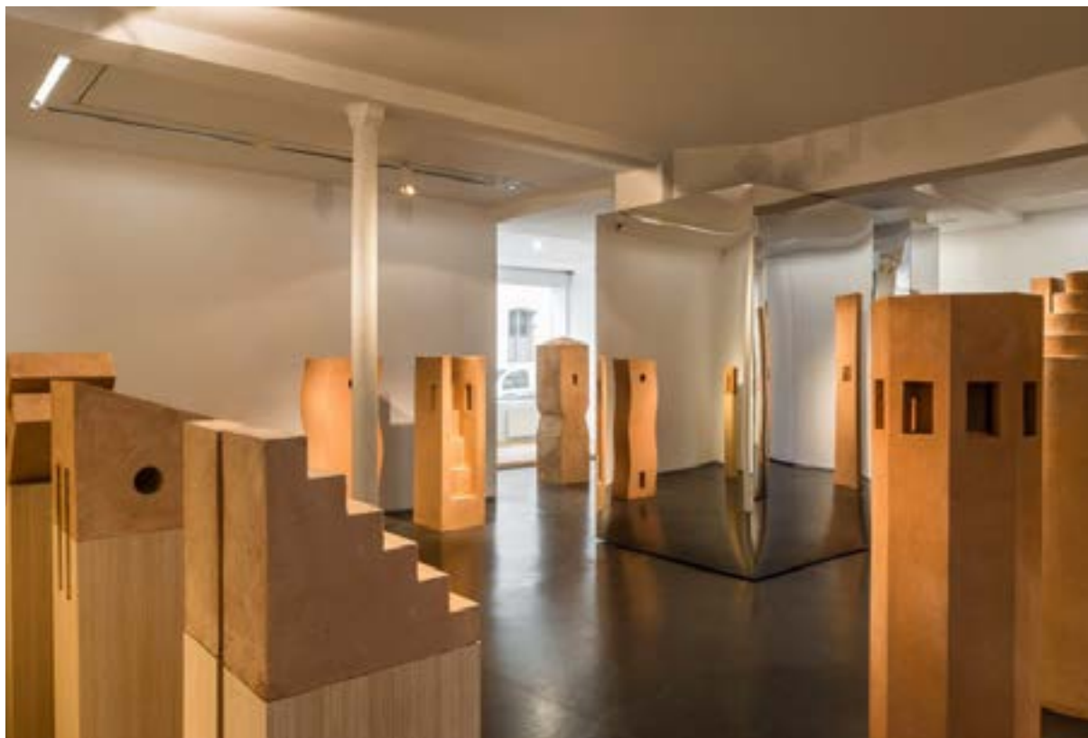
Dani Karavan Adama à la galerie Jeanne Bucher