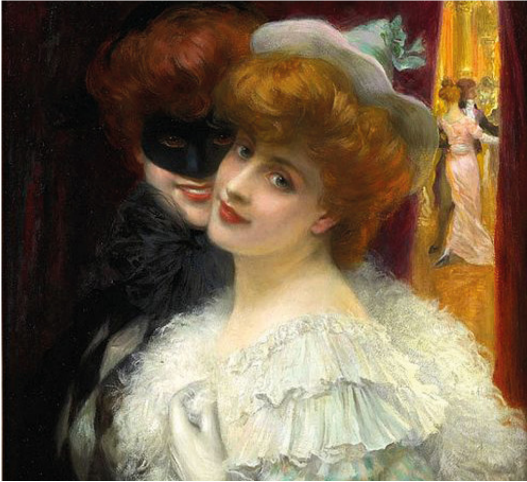
Le Bal masqué, Albert Lynch, avant 1912