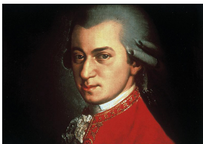
Portrait de Wolfgang Amadeus Mozart, Johann Nepomuk della Croce (1780)

Né à Salzbourg, Wolfgang Amadeus Mozart appartient à une famille de musiciens autrichiens originaires d'Allemagne. Son père, Leopold Mozart est lui-même compositeur et violoniste dans l'orchestre de l'archevêque de Salzbourg de 1743 jusqu'à sa mort. Wolfgang aborde très rapidement la musique ; il joue bientôt du clavecin, puis étudie le violon. Il étonne par sa capacité à improviser, à déchiffrer et à mémoriser les partitions.