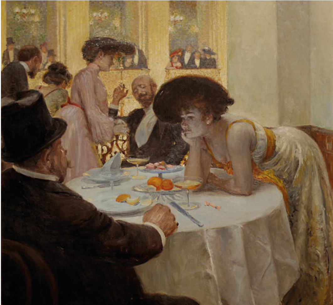
Loge im Sofiensaal, Joseph Engelhart, 1903