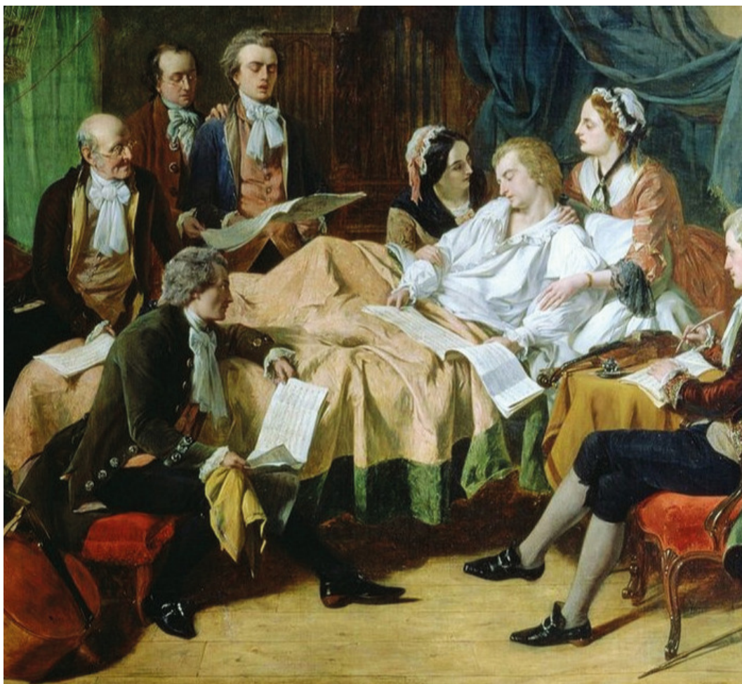
The Last Hours of Mozart, Henry Nelson O'Neil 1849