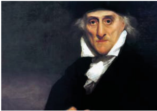
Portrait de Lorenzo Da Ponte

Originaire d'une ville modeste de la République de Venise, Ceneda (aujourd'hui commune de Vittorio Veneto), il va marquer les esprits par une vie aventureuse et donjuanesque – ce dont il se rappellera dans sa carrière de librettiste –, caractéristique des intellectuels italiens de l'époque vivant dans une société en mutation où le mécénat artistique se raréfie. À la mort de sa mère, son père prend une jeune catholique pour épouse et la famille, juive alors, se convertit au catholicisme prenant le nom de Da Ponte, qui n'est autre que celui de l'évêque de la ville. Poussé par son père, il est ordonné prêtre en 1773 et devient professeur de lettres et de rhétorique aux séminaires de Portogruaro et de Trévise. Il migre de Venise en 1779, banni pour adultère, menant une vie de débauche entre parties de jeu et abus de plaisirs de diverses sortes. Trois ans auparavant, il avait dû démissionner de ses fonctions pour avoir fait des écrits imprégnés d'idées des Lumières.