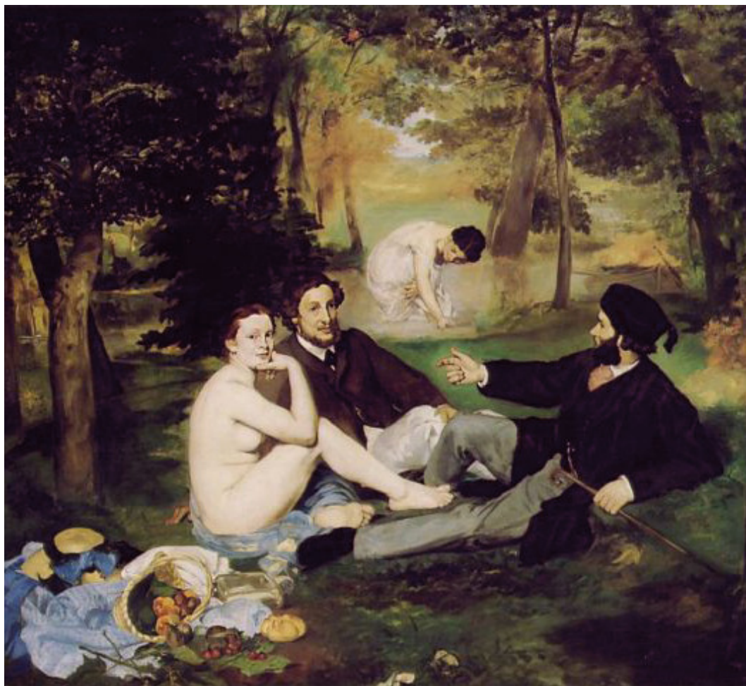
Le Déjeuner sur l'herbe, Édouard Manet, 1863