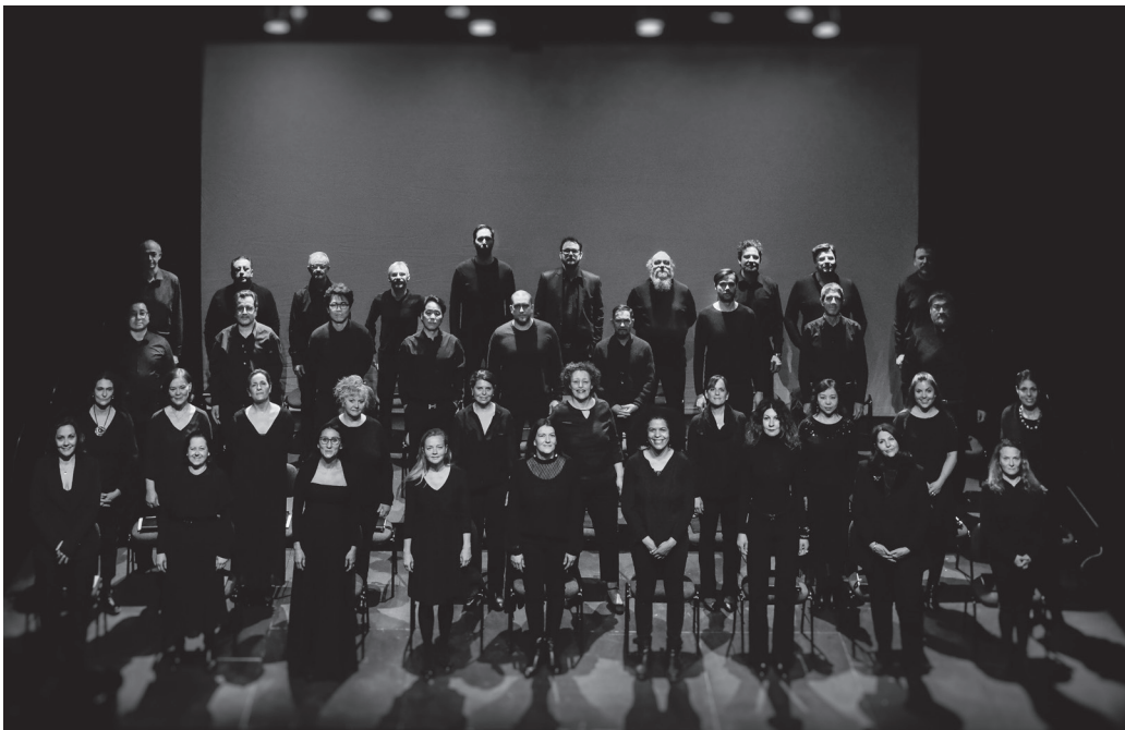
Chœur de l'OnR