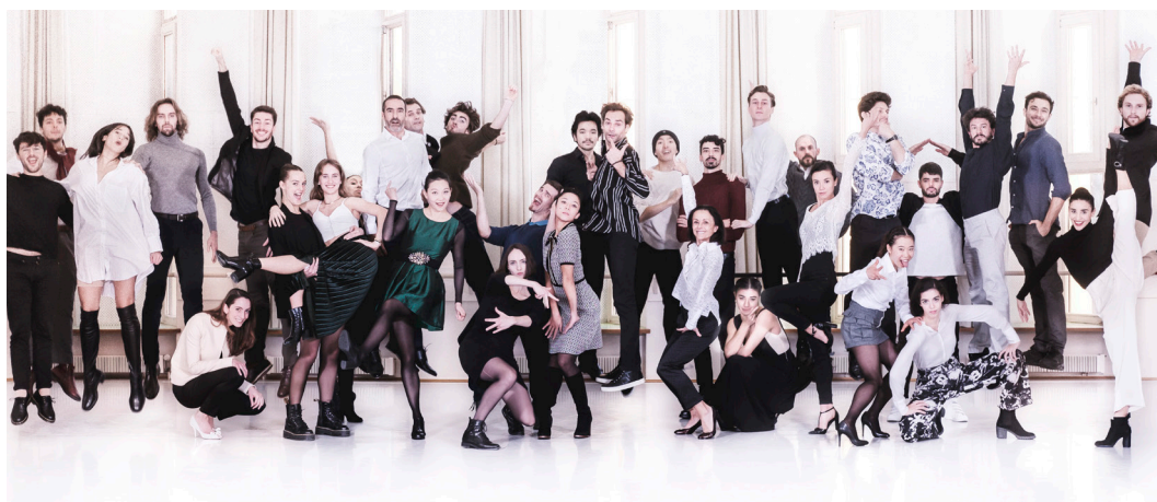
Ballet de l'OnR

Le Ballet diversifie également ses horizons artistiques. Situé au carrefour de l'Europe, il explore des dramaturgies et des sujets inédits, en prise avec le monde d'aujourd'hui. La programmation de formes nouvelles et de pièces portées par de jeunes danseurs chorégraphes contribue à faire bouger les frontières de la danse pour faire dialoguer interprètes et chorégraphes, artistes et spectateurs, tradition et prise de risque, modernité et renouveau.