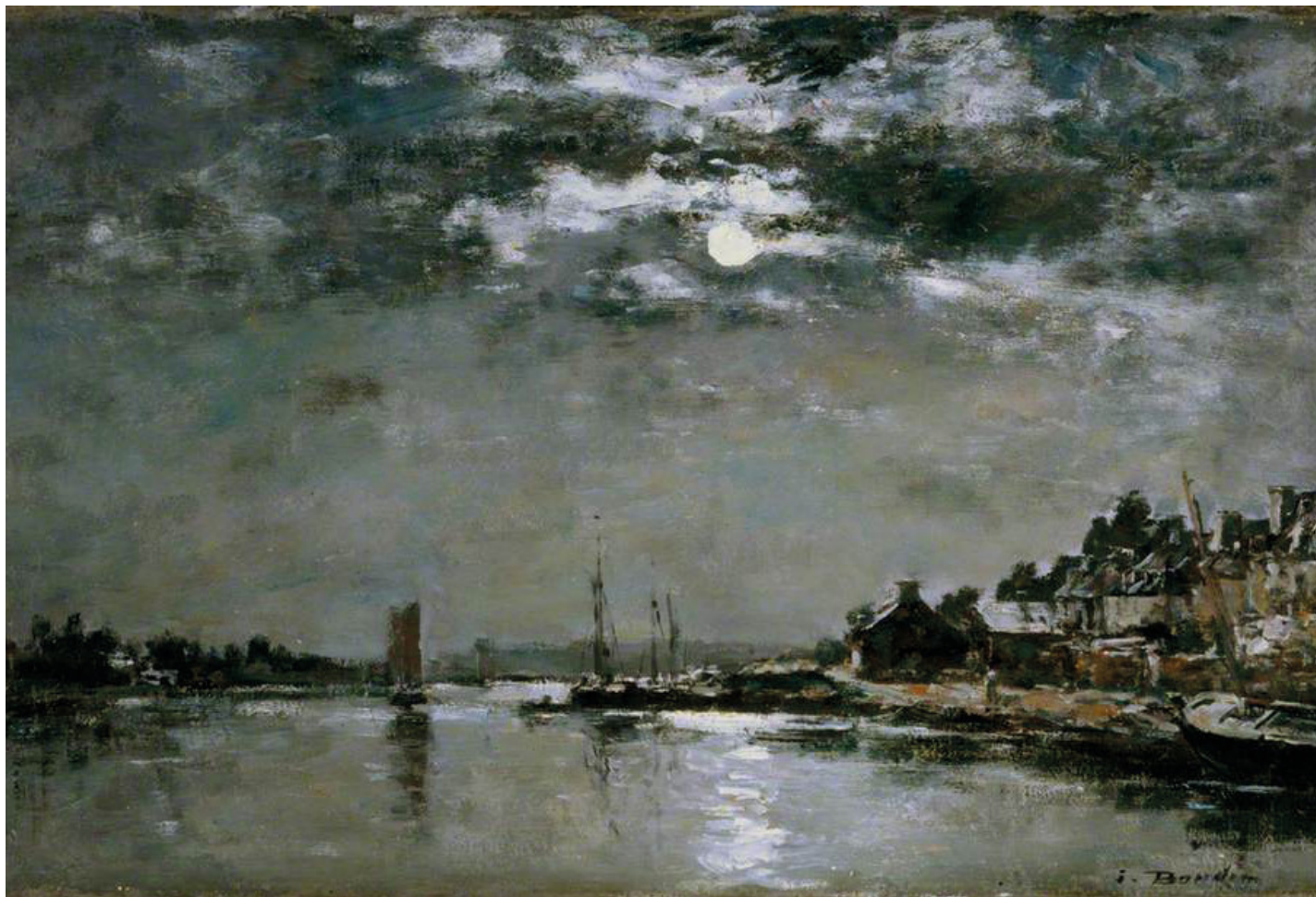
Le village du Faou au clair de lune, Eugène Boudin, entre 1860 et 1865