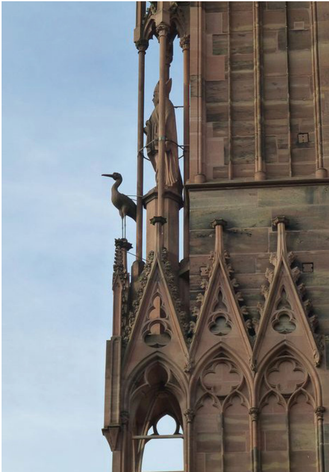
Cathédrale de Strasbourg

Si le silence est d'or la plupart du temps pour ce grand oiseau, la vie se fait bien plus cadencée lorsqu'il décide de se faire entendre. La cigogne craque, craquette, claquette, glottore, autant de verbes pour désigner la rythmique de ses claquements de bec qui résonne comme ceux d'un pivert contre un tronc d'arbre.