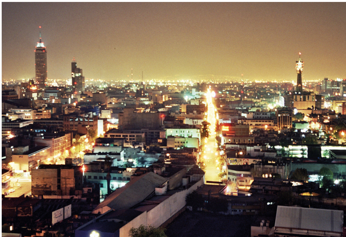
Mexique, City at Night