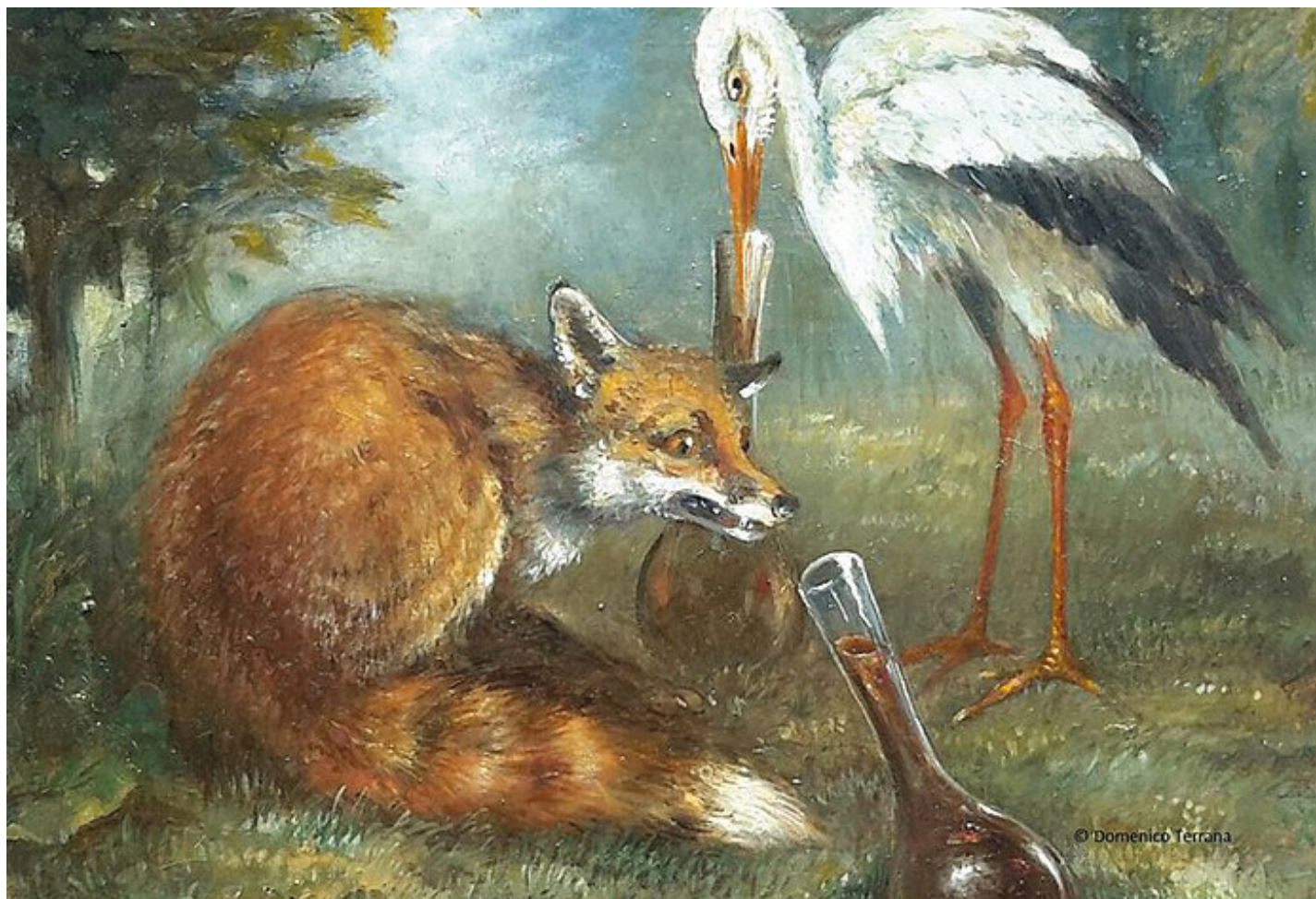
Le renard et la cigogne - Fable d'Ésope, Domenico Terrana