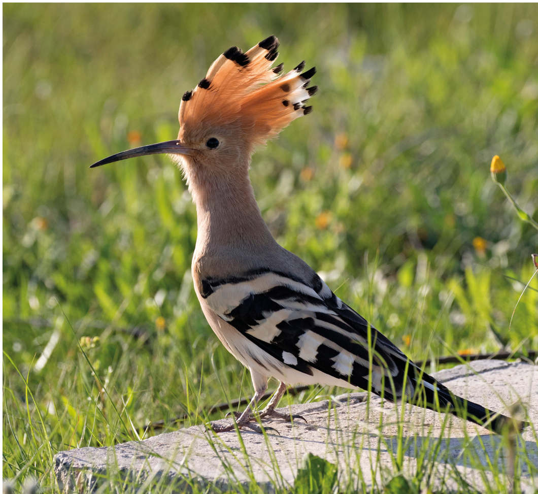
Huppe fasciée

Voilà qu'une jeune femme, tout juste mariée, se peignait devant son miroir. Elle fut prise de court par son beau-père qui entra sans être invité. Dans la panique, elle se métamorphosa en oiseau et prit ses ailes à son cou, laissant choir le peigne dans sa chevelure. Cet oubli lui valu cette crête de plumes rebelles et le nom perse de shânières signifiant «peigne en tête».