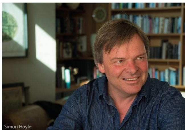
Portrait du Howard Moody